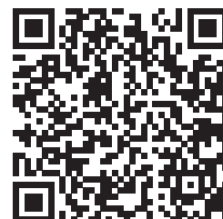
しおり (OB・OG 共有用)